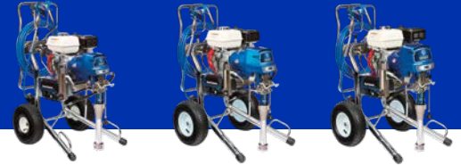
GMAX II ProContractor 3900 5900 (5900 HD) 7900 (7900 HD)